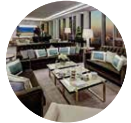
Waldorf Astoria Hotel | Berlin Deutschland