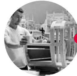
Entwicklung des Holzgestells in Saragossa (Spanien) Handwerksbetriebe