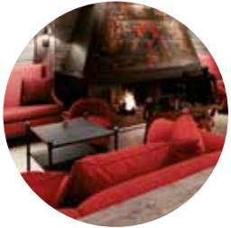
Le Crans Hotel | Crans Montana Frankreich