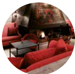
Le Crans Hôtel | Crans Montana France