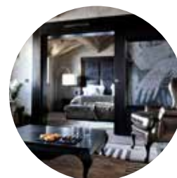
Le Lana Hôtel | Courchevel France