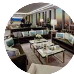
Waldorf Astoria Hôtel | Berlin Allemagne